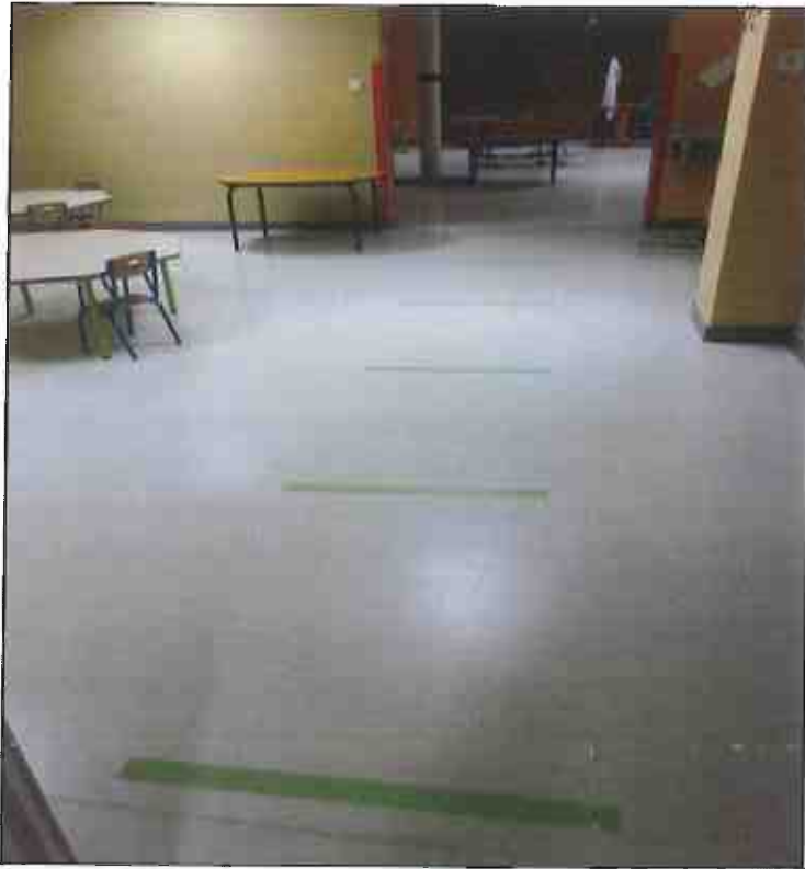
Marquage au sol : règles de distanciation physique